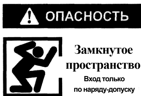
Рекомендуемый знак «ОЗП».